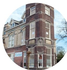
Locatie Rijswijk Oranjelaan 1 2281 GA Rijswijk