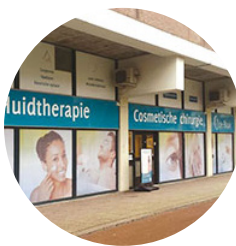
Locatie Rotterdam Blaak 243 / 285 3011 GB Rotterdam