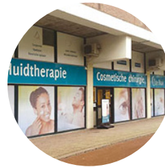
Locatie Rotterdam Blaak 243 / 285 3011 GB Rotterdam