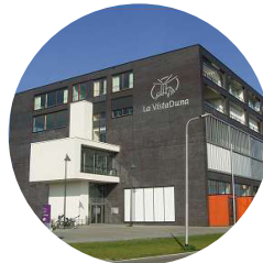
Locatie Tilburg Ketelhavenstraat 39 5045 NG Tilburg