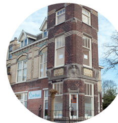
Locatie Rijswijk Oranjelaan 1 2281 GA Rijswijk