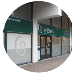
Locatie Rotterdam Blaak 243 / 285 3011 GB Rotterdam