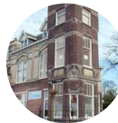
Locatie Rijswijk Oranjelaan 1 2281 GA Rijswijk