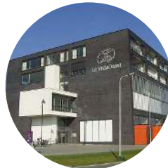
Locatie Tilburg Ketelhavenstraat 39 5045 NG Tilburg